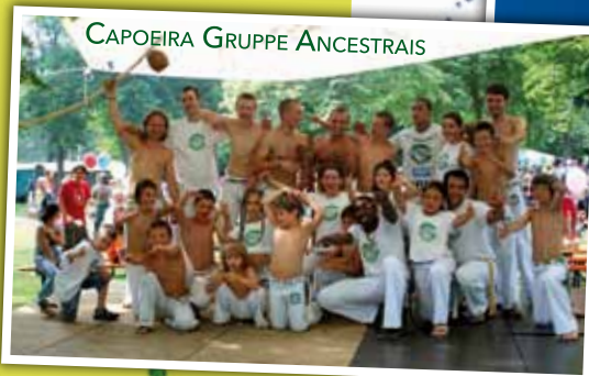
CAPOEIRA GRUPPE ANCESTRAIS