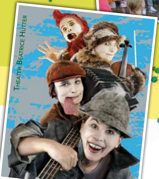
THEATER BEATRICE HÜTTER