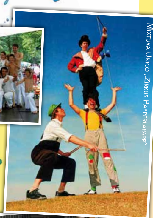
MIXTURA UNICO „ZIRKUS PAPPERLAPAPP“